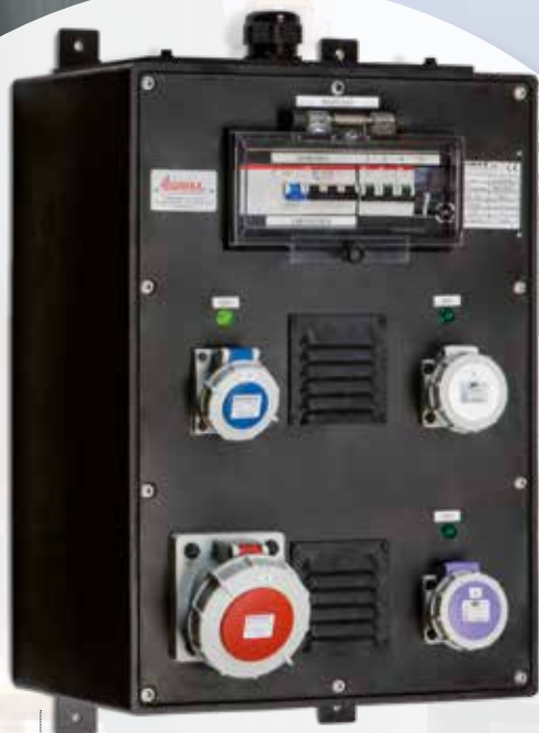
Wandmontage / Montage mural Trafo / Transformateur Hoher IP / Haute IP