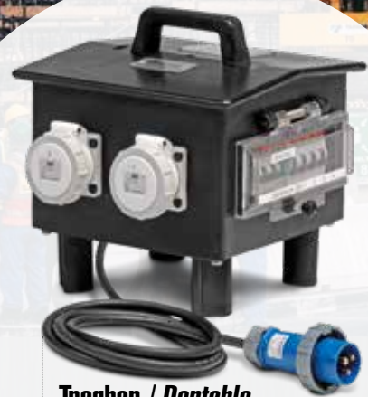
Tragbar / Portable Trafo / Transformateur Hoher IP / Haute IP