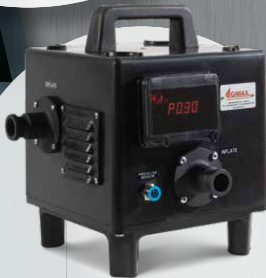
Tragbares Gebläse Gonfleur portable

LE CAOUTCHOUC BUTYLIQUE est le matériau qui caractérise les tableaux électriques réalisés par Gimax. En effet, l'entreprise a toujours été orientée vers la recherche des normes de qualité les plus élevées et est devenue, dès les années 90, une véritable pionnière dans l'utilisation de ce matériau. Dès le début de son